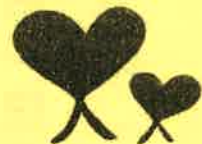
枚方人権まちづくり協会